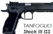
TANFOGLIO Stock III ISS